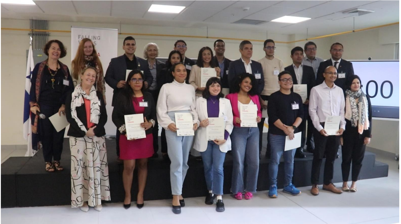
Las y los participantes del concurso en conjunto con el jurado y el comité organizador.