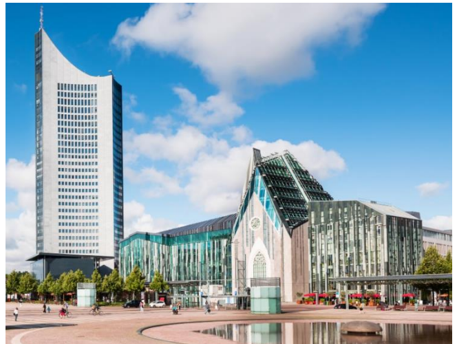
Universidad de Leipzig en el Augustusplatz.

No importa de qué país de Latinoamérica vienes ( esta oportunidad no está restringida a mexicanos), concluyendo tu licenciatura con buenas notas (aquí son aceptadas varias áreas de humanidades) y teniendo el nivel B2 de alemán , tú tienes los principales requisitos para postularte a la Maestría Interinstitucional en Deutsch als Fremdsprache: Estudios Interculturales de Lengua, Literatura y Cultura Alemanas de la Universidad de Guadalajara (México) en cooperación con la Universidad de Leipzig (Alemania). Esta maestría binacional se constituye de dos semestres de estudio en México y dos en Alemania y, como la estancia en Alemania es parte integrante y obligatoria de esta maestría, se concede a sus estudiantes, a través del DAAD y del CONACYT, la oportunidad de ir becados a Alemania para estudiar en una de las universidades más tradicionales, especializadas y conocidas