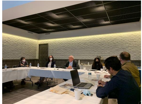
El Prof. Hans-Jürgen Puhle de la Universidad de Fráncfort da su ponencia magistral.

Casi todos los países del mundo se llaman oficialmente democracias. La democracia es más relevante que nunca, pero también está más atacada que nunca. El simposio "Las democracias y sus enemigos" , organizado por el DAAD y la Cátedra Humboldt del Colegio de México, reunió los días 29 y 30 de noviembre a investigadores de muchos países del mundo para examinar científica y académicamente los síntomas que actualmente padecen muchos países y buscar soluciones (fuera de los Estados-nación). Por ello, el simposio se dedicó a la cuestión de cómo podemos enfrentarnos juntos a estos retos.