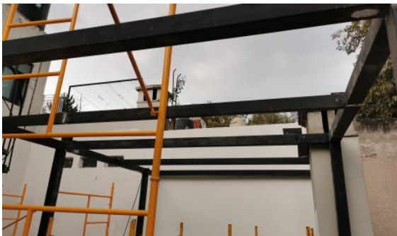
Rediseño de la terraza de la Oficina Regional.

La Ciudad de México es una de las megalópolis más grandes del mundo; más de 21 millones de personas viven Zona Metropolitana. A su vez, México tiene las condiciones climáticas ideales para utilizar la energía del sol para la producción de energía limpia y nuevas tecnologías. Es por tal motivo que el equipo del DAAD México ha decidido rediseñar sus instalaciones, de acuerdo con los requisitos para la protección del clima y los recursos. El proyecto más ambicioso es la instalación de 12 paneles solares que cubren el 100% del consumo eléctrico de la oficina y producen un excedente que se inyecta a la red estatal. Al cambiar a la energía solar, se pueden ahorrar alrededor de 4.5 toneladas de CO 2 al año. Los paneles solares tienen una garantía mínima de 25 años y la inversión inicial se amortizará en 4 años.