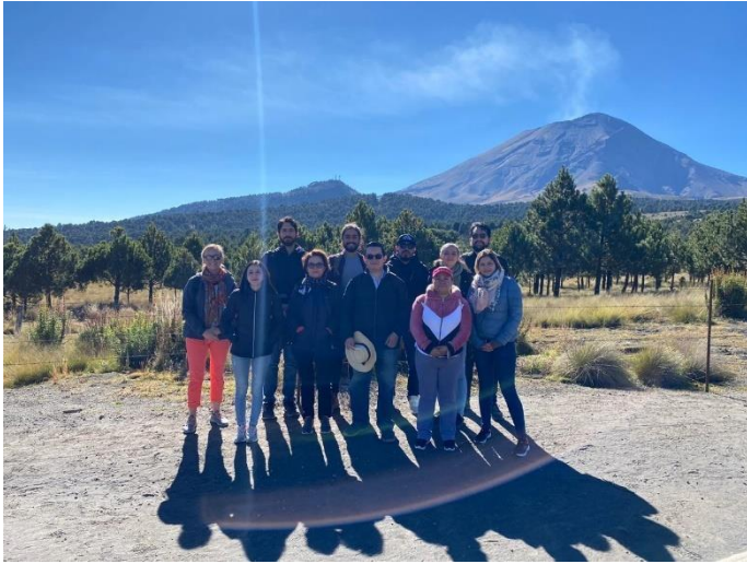
Los equipos de México y Costa Rica en el Paso de Cortes. En el fondo se ve el Popocatepetl.

Estamos todos muy contentos por poder acompañar este proceso enriquecedor, así como por conocer más a detalles toda la región.