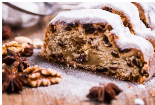
Una delicia navideña muy popular en Alemania: el Stollen.

Adivina correctamente y gana una de tres tazas del DAAD.