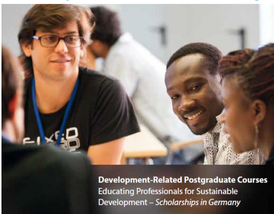
Development-Related Postgraduate Courses Educating Professionals for Sustainable Development – Scholarships in Germany

Todavía puedes aplicar para el programa EPOS, el cual está dirigido a egresados que cuenten con mínimo dos años de experiencia laboral y estén interesados en contribuir con el desarrollo económico y social de México. Más de 40 programas de posgrado en las áreas de agricultura, ciencias forestales, economía, medios, salud pública, sustentabilidad y urbanismo pueden obtener financiamiento por parte del DAAD.